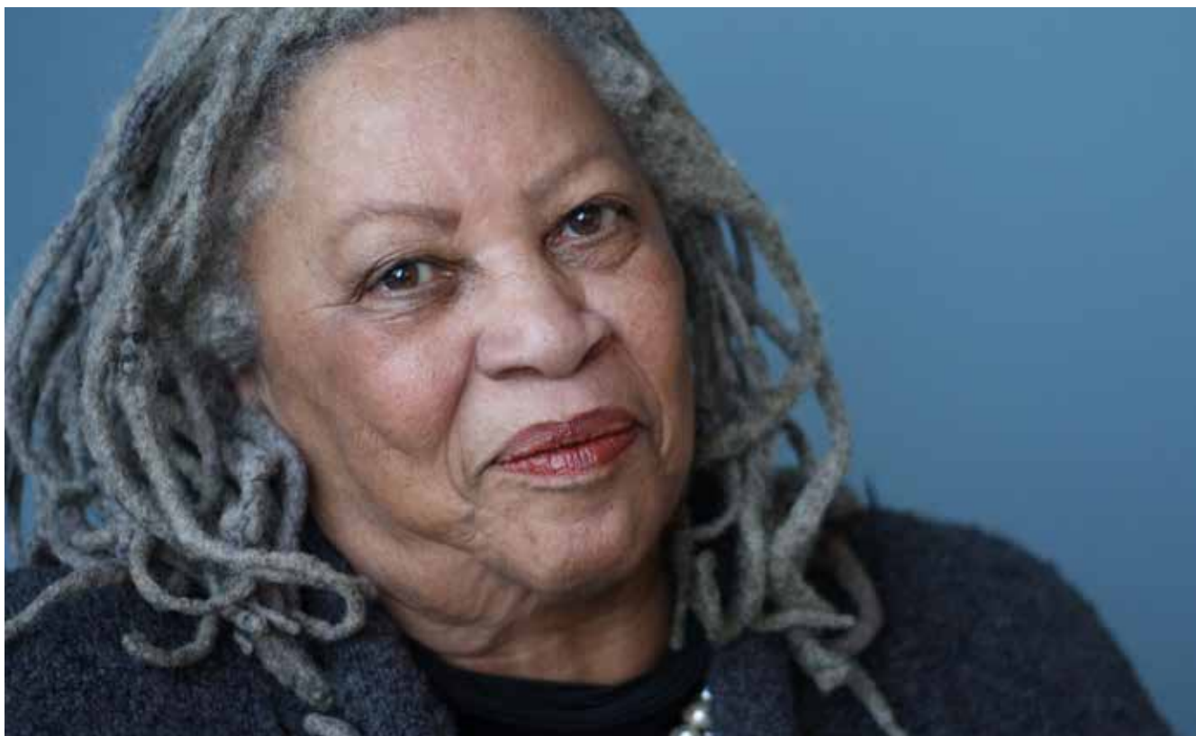
Toni Morrison.

straffades med fängelse i tjugufem år eller livstid. På hemvägen sökte modern Lulas hand, log mot henne, och höll den där hela vägen, och den var varm.